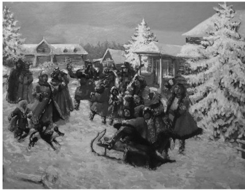
Святочные гуляния. Художник Владимир Рябчиков

Двенадцать дней после Рождества до Крещения Господня называются Святками – то есть святыми днями, освященными приходом в мир Спасителя. Отмечать особо эти дни Церковь начала с древних времен. Уже в уставе VI века преподобного Саввы Освященного пишется, что в дни святок не полагается класть поклоны и совершать венчание. Вторым Туронским собором 567 года все дни от Рождества Христова до Богоявления названы праздничными. В первые дни праздника по традиции приня-